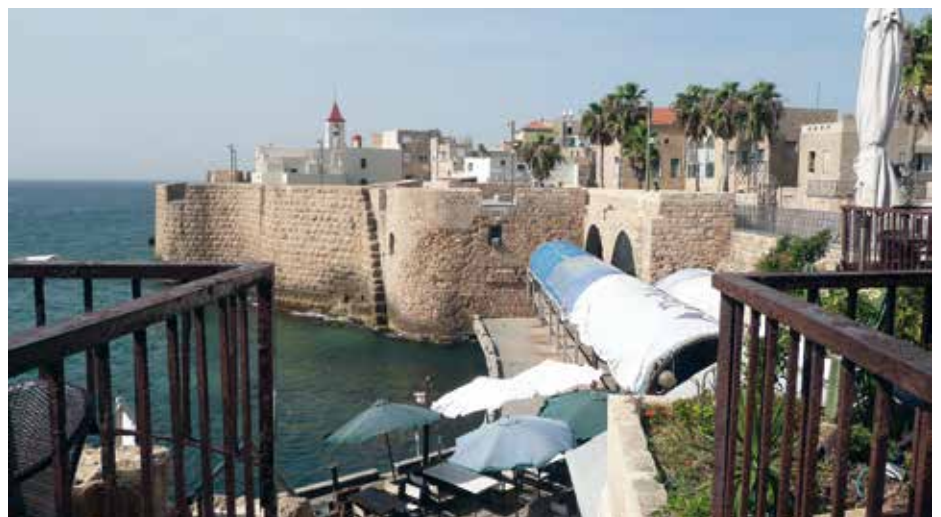
Zicht op de oude stad van Akko.

Dat moet een duizendpoot zijn: vloeiend Arabisch, Hebreeuws en Engels spreken en schrijven, kennis en ervaring hebben met de wet- en regelgeving in Israël voor stichtingen en het bankwezen en financieel inzicht.