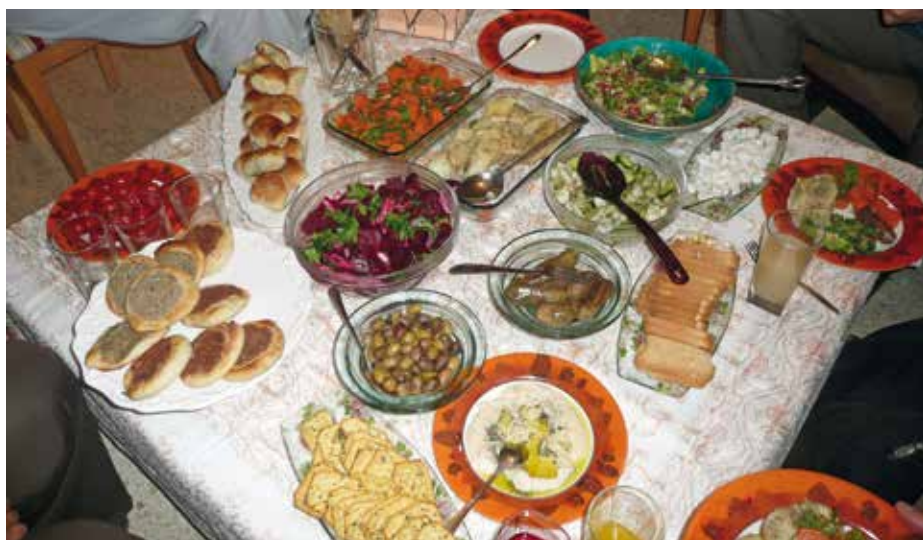
Heerlijke Palestijnse gerechten thuis.

Zij kan alle colleges online kan volgen, en dat gaat redelijk goed. Ze beschikt over bijna alle leerstof en kan bij vragen, chatten met de leraren. Zij is tevreden, maar wel een beetje bang