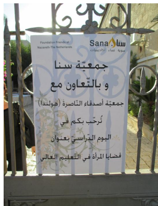
Affiche met de aankondiging van de conferentie

Bestuur Stichting Vrienden van Nazareth Februari 2014