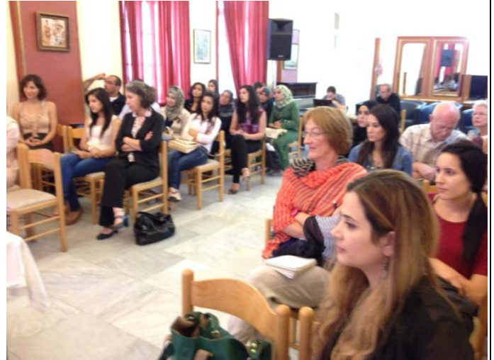
De conferentie van Sana Foundation

2013 Een vruchtbaar jaar, dat heeft de conferentie in Nazareth, georganiseerd door het bestuur van Sana Foundation, laten zien. De interesse en passie voor het belang van onderwijs voor Palestijnse vrouwen in Israël, hebben wij daar ervaren. Het bewustzijn dat zij zelf, na 25 jaar studiebeurzen vanuit Nederland, aan