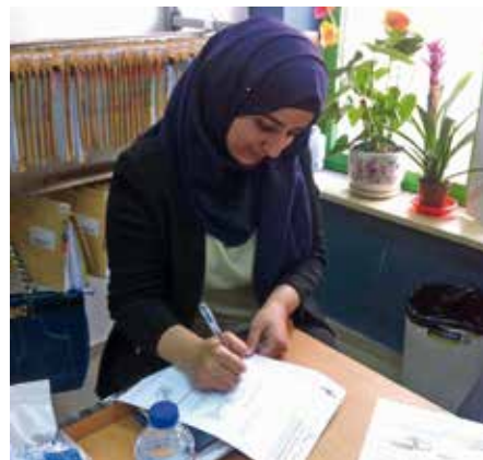
Waed aan het werk.

voor me heb. Dank dat ik deze kans gekregen heb.