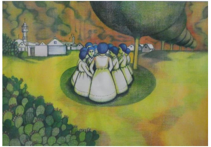
'In de kracht van saamhorigheid' kunstwerk van Sager al Qatil, een cadeau van de Stichting aangeboden aan SANA Foundation

Samen blijven we zoeken naar wegen om gestalte te geven aan een definitieve verantwoorde opzet.