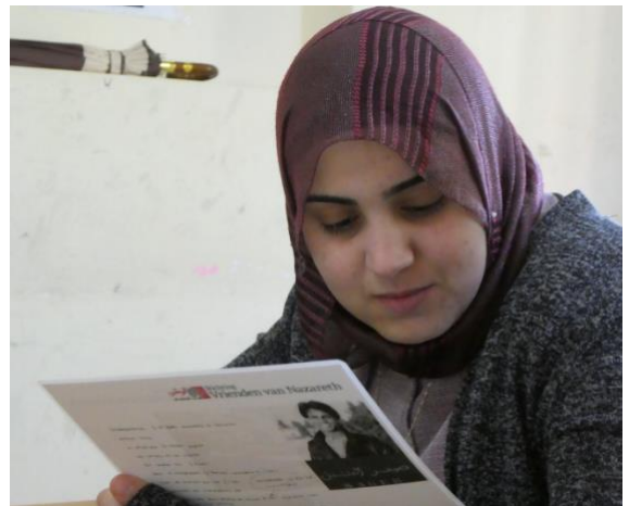
Janan: "Studeren is ons wapen"

Een geormerkte donatie aan de Stichting kon op verzoek om bemiddeling, besteed worden aan een noodaanvraag voor het laatste halve jaar Verpleegkunde van een student in Gaza. Bij uitzondering is ook aan een studente uit de West Bank een studiebeurs verleend voor haar studie Mathematics. Met de instroom van een nieuwe studente Verpleegkunde, studeren in oktober 2017 acht studenten. Een studente Geneeskunde rondt in die periode haar examens af om daarna aan haar co-schappen te beginnen.